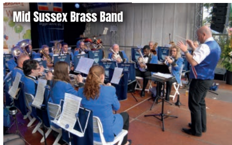
Mid Sussex Brass Band