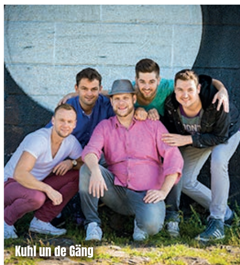
Kuhl un de Gäng