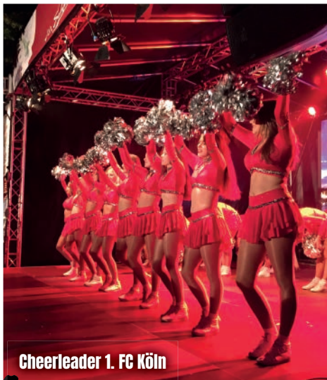
Cheerleader 1. FC Köln